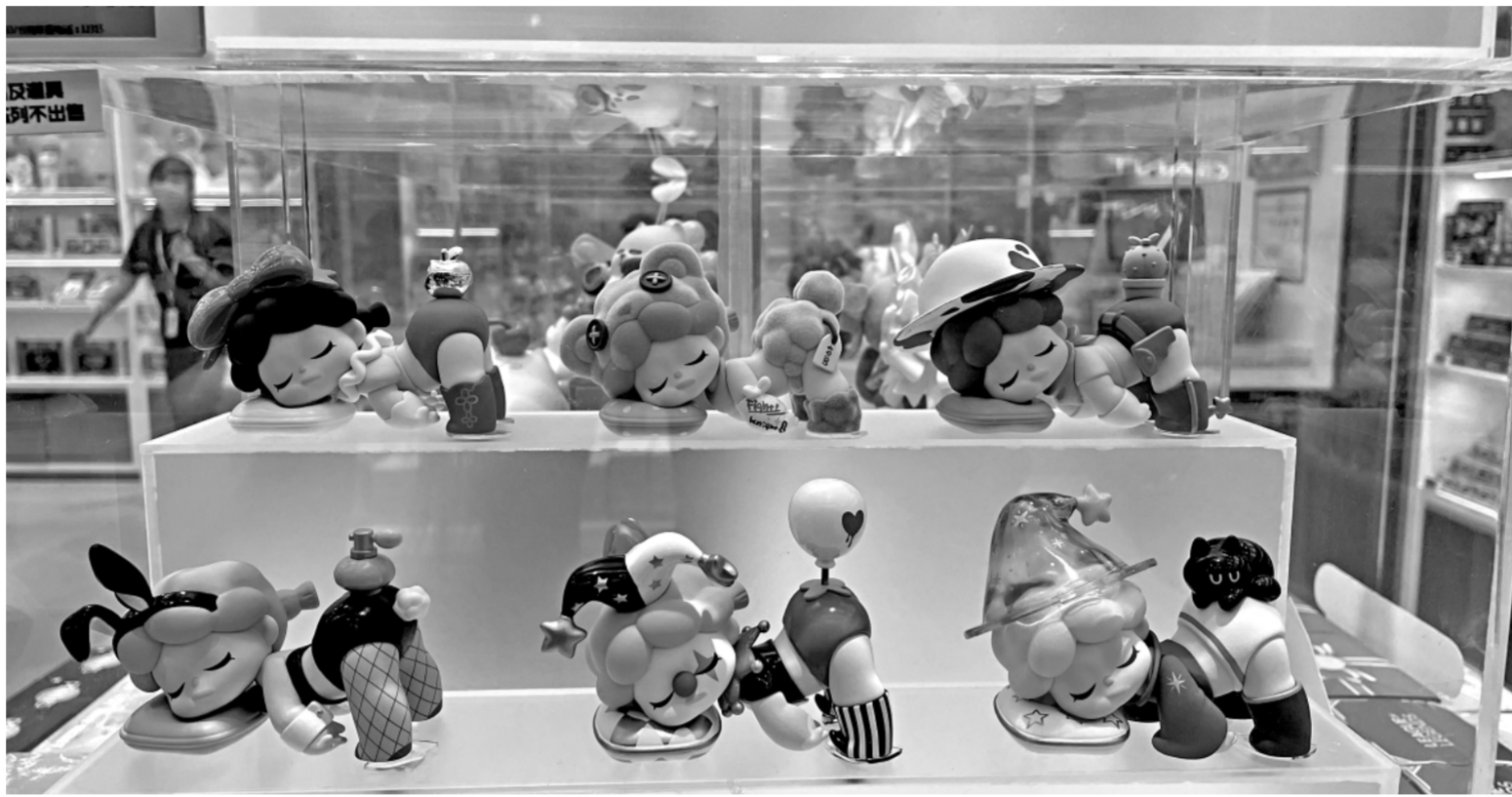
北京市海淀区某潮玩店内摆放的盲盒产品，其服饰造型受到部分家长质疑。

随着价格亲民、造型可爱的盲盒产品推出，潮玩盲盒受到越来越多的人喜爱。为了收获粉丝的支持，厂商只能在题材造型上做文章，有争议才有话题性，甚至可能提高产品“知名度”，于是出现了一些颇受争议的盲盒产品。比如，那款主打暗黑风格盲盒，虽然让不少人觉得“瘆得慌”，但并不妨碍其成为爆款，在某电商平台品牌旗舰店内，该款盲盒仅一个月内销量就达“4000+”。