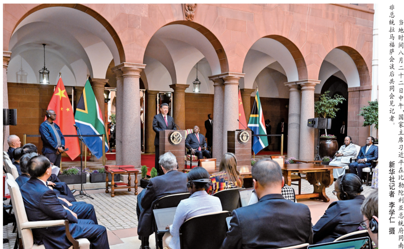
当地时间八月二十二日中午，国家主席习近平在比勒陀利亚总统府同南非总统拉马福萨会谈后共同会见记者。