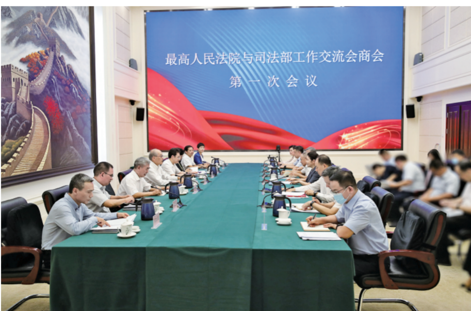
8月22日，最高人民法院、司法部召开工作交流会商会第一次会议。

张军强调，人民法院和司法行政机关都是党绝对领导下的政法单位。开展交流会商对于把党的这一制度优势转化为治理效能，努力跟上、适应、满足人民群众对公平正义的更高需求，共同促进司法公正和法治进步，更好推动在法治轨道上全面建设社会主义现代化国家，具有非常重要的意义。下一步关键是在党的领导下做好请示报告、做实工作衔接、狠抓会商成果落地见效的“后半篇文章”。要加强沟通协调，围绕会议确定的框架和重点任务，密切具体职能部门之间积极、顺畅、务实的沟通。坚持刀刃向内，对于落实中的不同意见，要