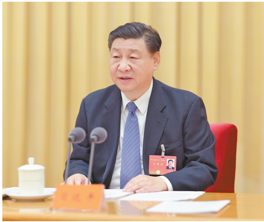
12月11日至12日，中央经济工作会议在北京举行。中共中央总书记、国家主席、中央军委主席习近平出席会议并发表重要讲话。

新华社北京12月12日电 中央经济工作会议12月11日至12日在北京举行。中共中央总书记、国家主席、中央军委主席习近平出席会议并发表重要讲话。中共中央政治局常委李强、赵乐际、王沪宁、蔡奇、丁薛祥、李希出席会议。