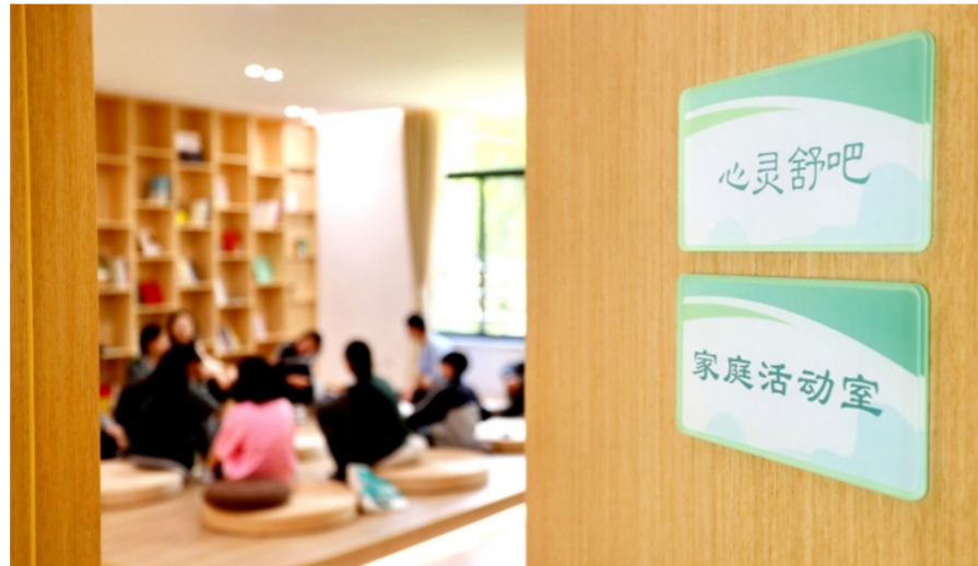
浙江省嘉兴市儿童青少年心理健康服务总站组织开展研学活动，引导学生们感知心理科学，探秘心灵成长。

全国人大代表、河南省信阳市固始县张老乡乡桥头村党支部书记汪荣秀发现，留守儿童因亲情缺失，在情感支持和社会交往中