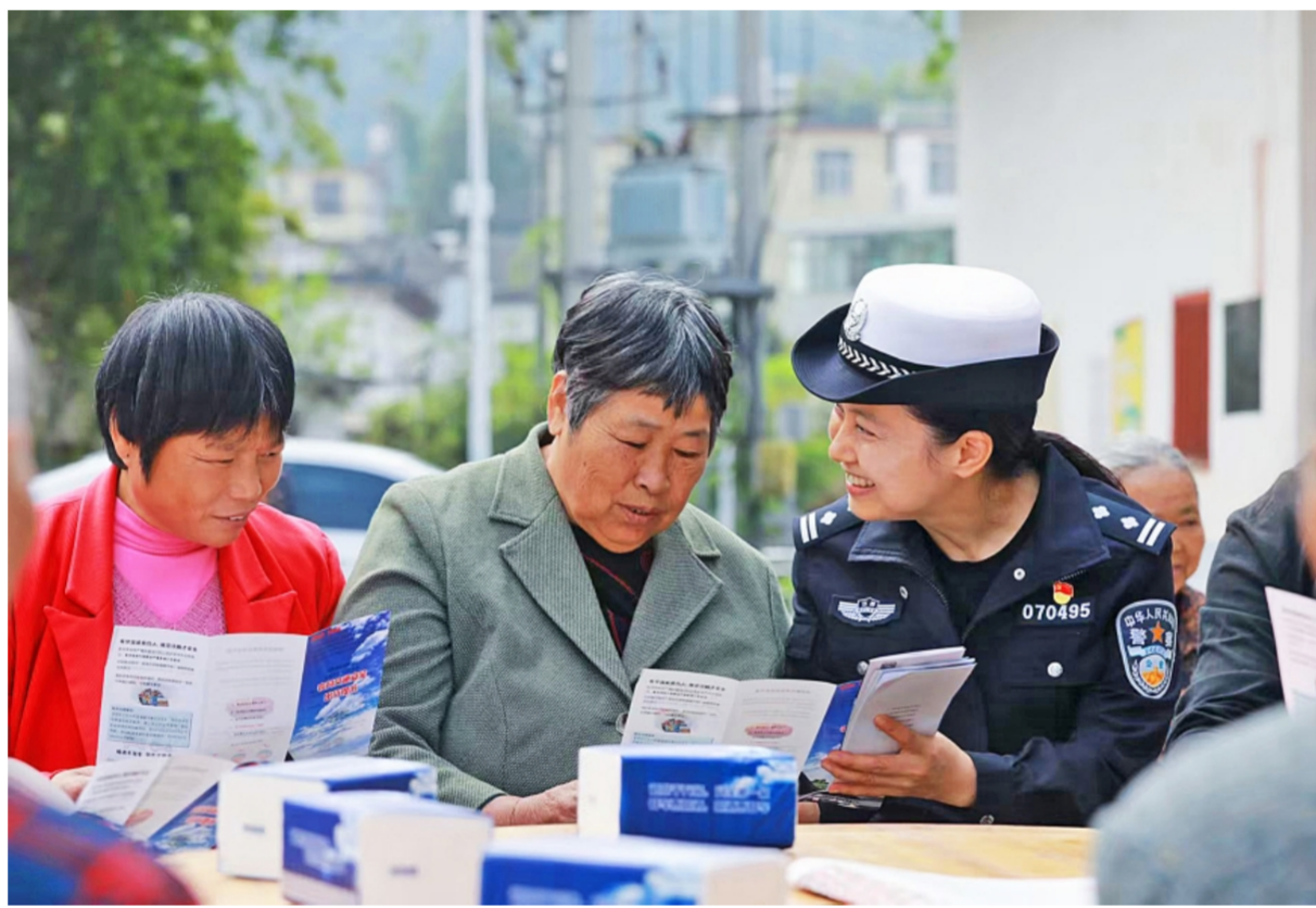
近日，江西省赣州市公安局交警支队章贡大队组织民警深入乡村，通过唠家常、以案说法、现场答疑等方式，向农村老人普及道路交通安全法律法规，提升群众安全意识。图为民警在王田村向老人宣讲交通安全知识。

与此同时，三中院将查明案件事实的过程，作为疏导当事人情绪、弥合亲情裂痕的契机，努力实现“事实查明”与“亲情修复”同步推进。此外，该院通过加强判后答疑，用群众听得懂的语言阐释裁判理由，促进当事人服判息诉；通过发布典型案例，进行普法宣传等方式，向社会清晰传递遗嘱订立的法律规则和标准，引导公众树立正确的遗产观。